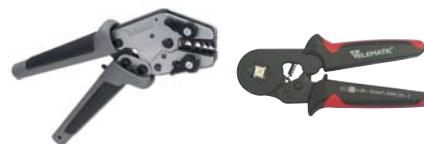
Tools for terminals, see pages 112; 122-123.